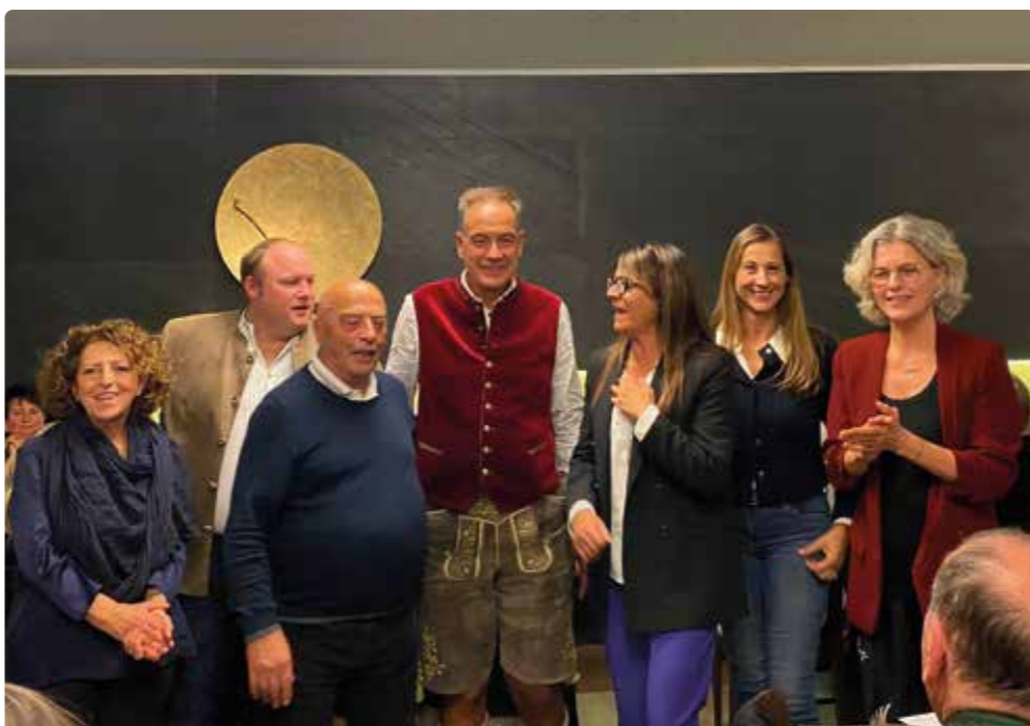
Oben: Auf der Wiesn. Unten: Bayerischer Abend mit Übergabe von Gastgeschenken.

Das Highlight war jedoch für einige Teilnehmer der Besuch der vielfach prämierten Brauerei Riegele.