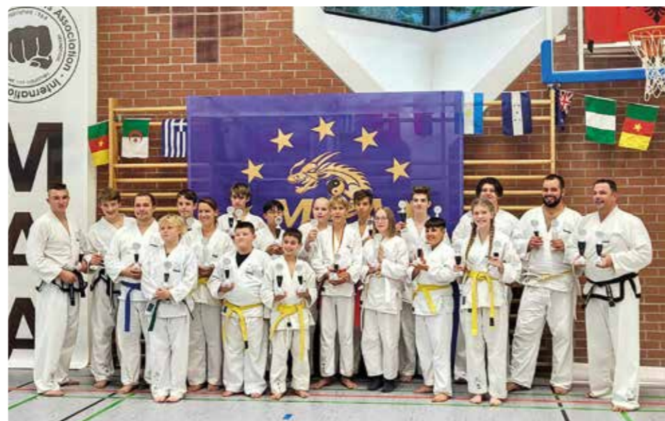
Foto: Die glücklichen Siegerinnen und Sieger aus der Kampfsportschule Odelzhausen.