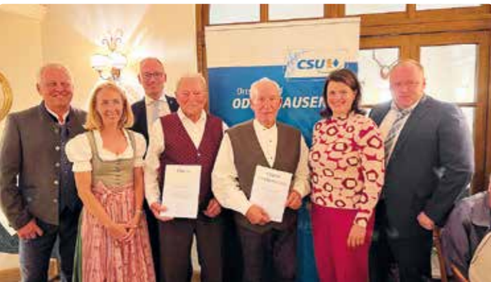
Aufgenommen beim 50jährigen Jubiläum des CSU-Ortsverbandes Odelzhausen.

Bei seiner Beerdigung im November nahm nicht nur seine Familie Abschied, sondern auch viele Weggefährten, Freude und Bekannte.