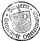
Markus Trinkl 1. Bürgermeister