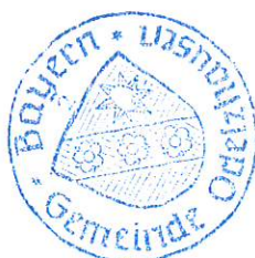
Markus Trinkl 1. Bürgermeister