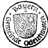
Markus Trinkl 1. Bürgermeister