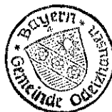
Markus Trinkl 1. Bürgermeister