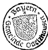
Markus Trinkl 1. Bürgermeister

Bekanntmachung von: 05.11.2024 Bekanntmachung bis: 12.11.2024