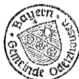
Markus Trinkl 1. Bürgermeister

Bekanntmachung von: 07.11.2024 Bekanntmachung bis: 15.11.2024