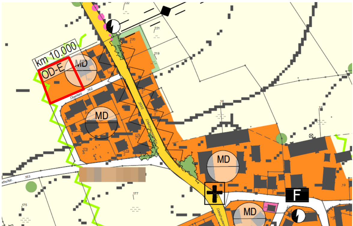
Abb. 2: Ausschnitt aus der wirksamen Fortschreibung des Flächennutzungsplanes, o.M.

Die vorliegende Einbeziehungssatzung ist aus der wirksamen Fortschreibung des Flächennutzungsplanes, die ein im Norden und Westen einzugrünendes Dorfgebiet darstellt, entwickelt.