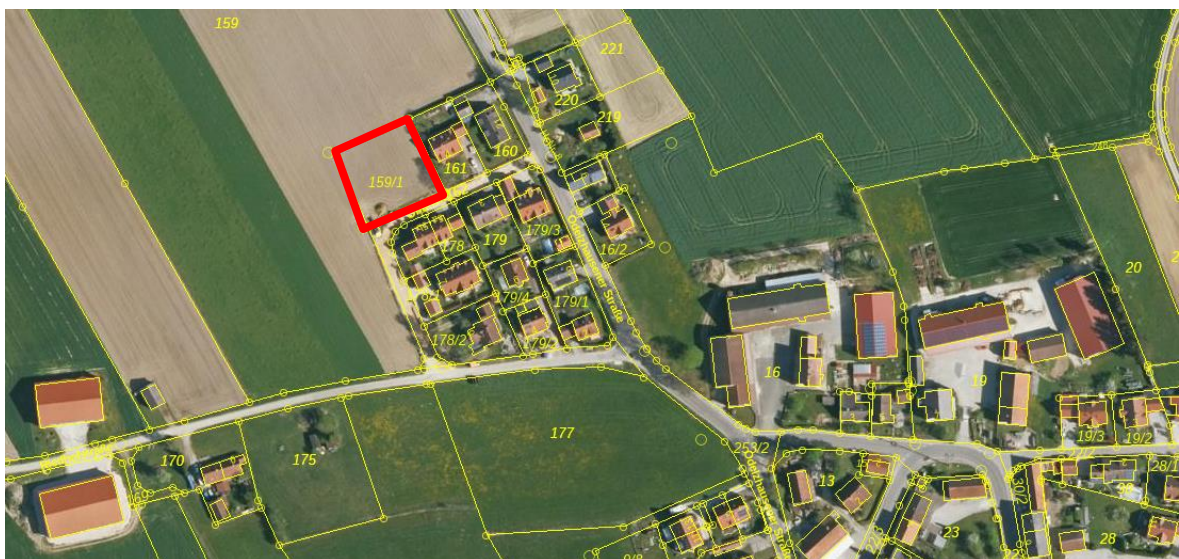
Abb. 1: Luftbild (Befliegungsdatum: 22.04.2020) vom Plangebiet (rot umrandet) mit Umgebung, o.M.

Das Plangebiet, das im Ortsteil Ebertshausen und damit ca. 2,7 km südöstlich des Hauptortes Odelzhausen liegt, grenzt im Norden sowie im Westen an intensiv bewirtschaftete Ackerflächen und im Osten sowie im Süden an Siedlungsflächen (Wohnbebauung) an. Zudem verlaufen in einer Entfernung von ca. 45 m die Kreisstraße DAH 6 und von ca. 1,0 km die Bundesautobahn A8.