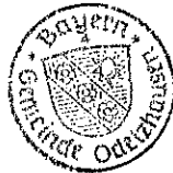
Markus Trinkl 1. Bürgermeister