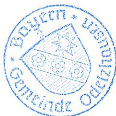
Markus Trinkl 1. Bürgermeister